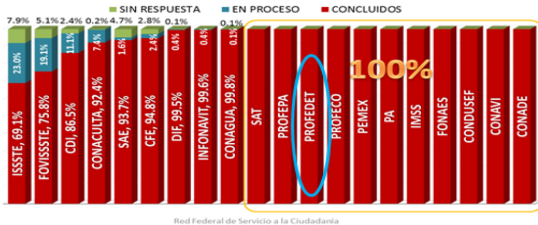
Gráfico 1 “Programa Rezago Cero”

Asimismo, se participó en el Programa de Espacios de Contacto Ciudadano (ECC) en 2012, al instalar el ECC de la PROFEDET.